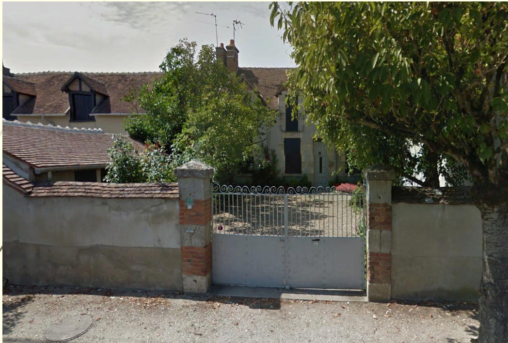
Maison 27 rue de Paris